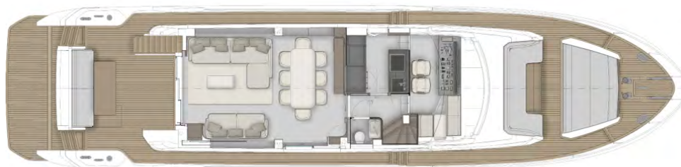
ГЛАВНАЯ ПАЛУБА - ОПЦ