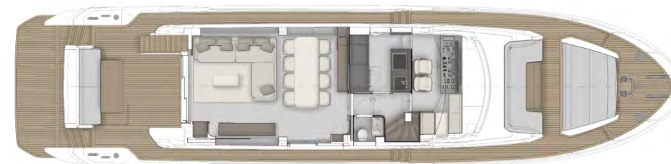
ГЛАВНАЯ ПАЛУБА - ОПЦ